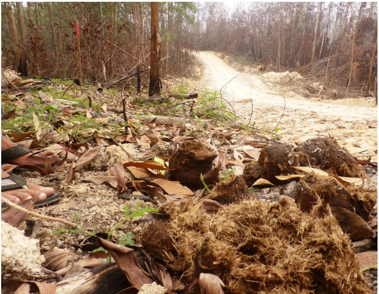
Gambar 3. Di areal terjadinya pembakaran hutan dan lahan di konsesi IUPHHK-HT PT. Putri Lindung Bulan, ditemukan kotoran Gajah Sumatera. Hal ini menunjukkan Konsesi HTI ini mengindikasikan habitatnya Gajah