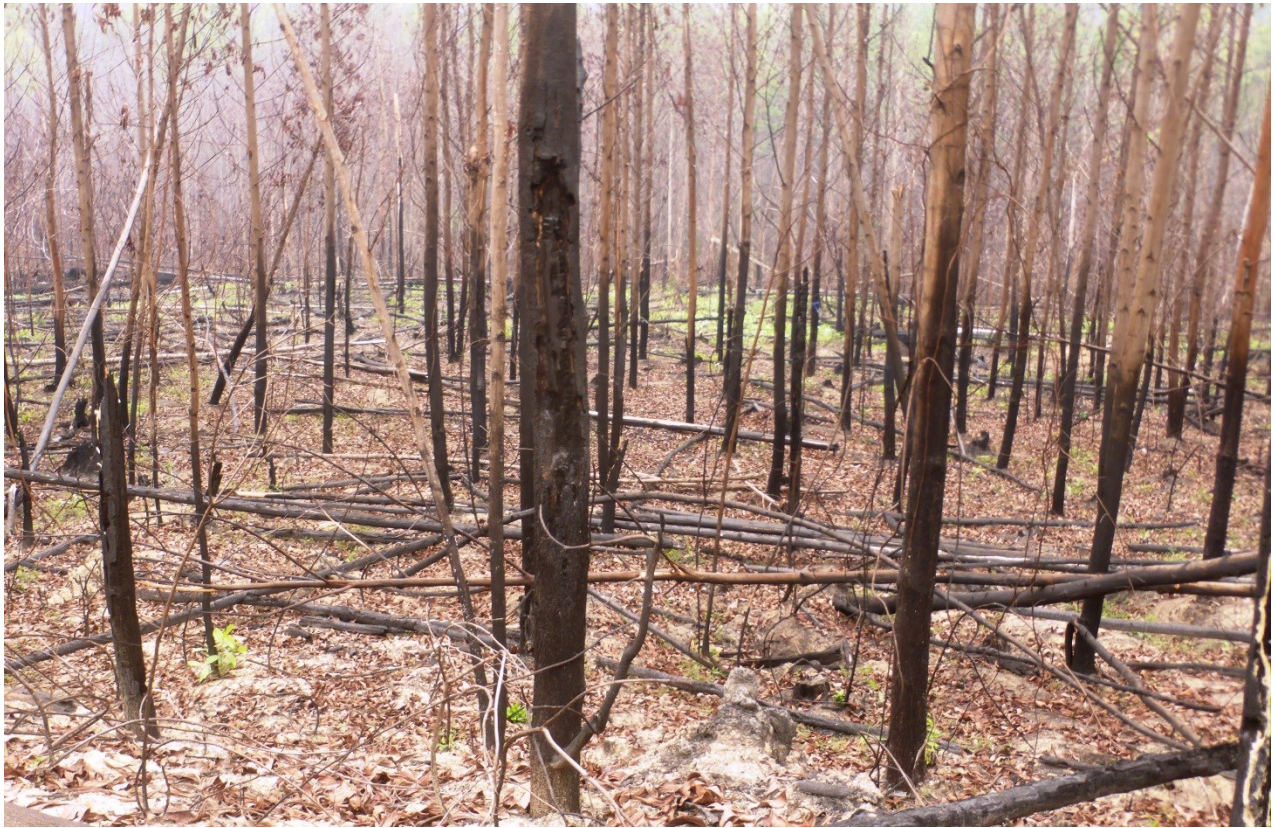
Gambar 1 dan 2. Pembakaran hutan dan lahan mencapai 20 hektar, akasia yang berumur 5-6 tahun di konsesi IUPHHK-HT PT. Putri Lindung Bulan. Pembakaran hutan dan lahan ini diperkirakan terjadi pada Agustus-September 2015. Gambar diambil pada titik koordinat S0^{\circ}18'42.06'' E101^{\circ}54'30.63'' (gambar 1) dan S0^{\circ}18'29.19'' E101^{\circ}54'14.40'' (gambar 2). Gambar diambil tanggal 15 Oktober 2015.